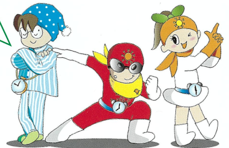
早寝早起きおいしい朝ごはん応援隊